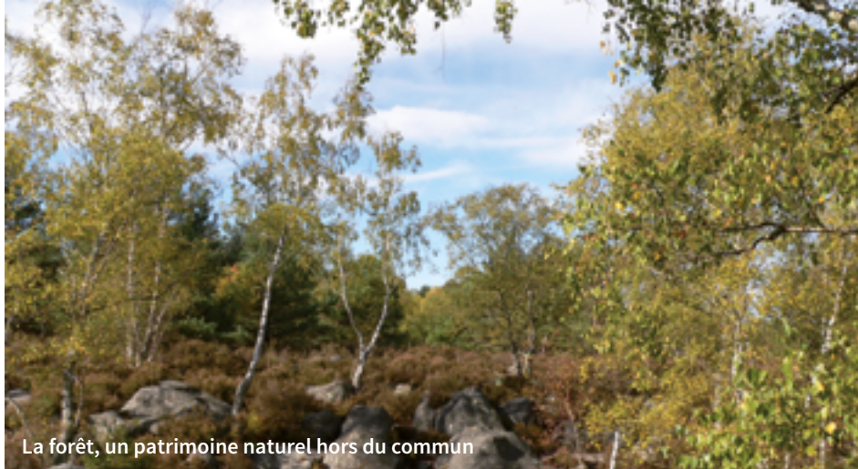
La forêt, un patrimoine naturel hors du commun