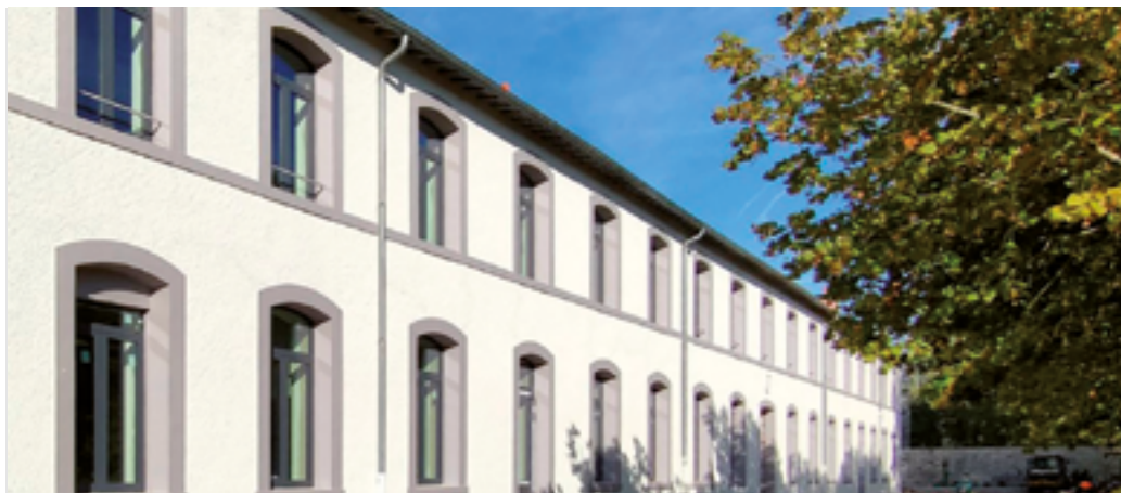
Les bâtiments rénovés du campus Damesme