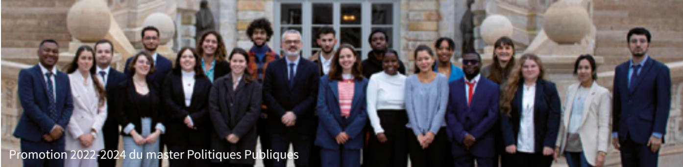
Promotion 2022-2024 du master Politiques Publiques