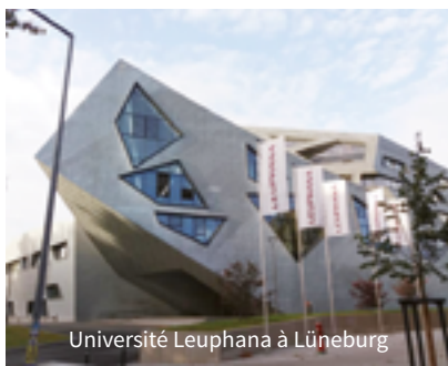
Université Leuphana à Lüneburg