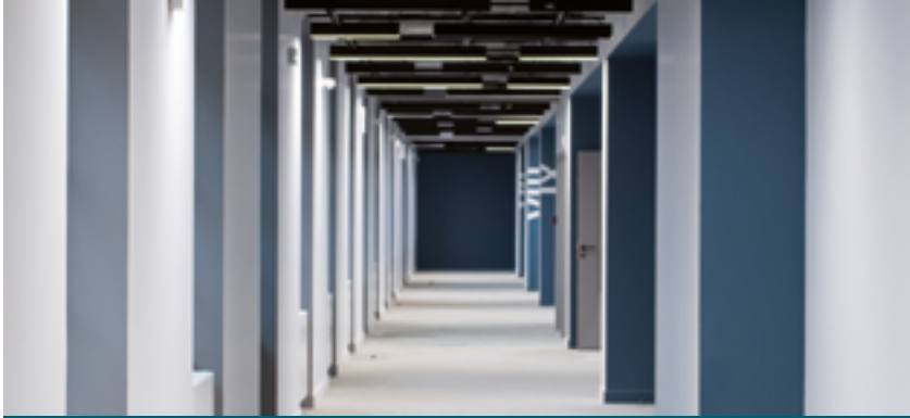
L'intérieur du campus