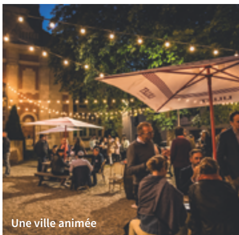
Une ville animée