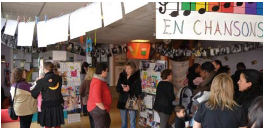
RAM de la Plaine de France à Othis

Le Relais Assistantes Maternelles a eu le plaisir d'accueillir le samedi 6 avril parents, futurs parents et assistantes maternelles à l'occasion de sa journée Portes ouvertes. Au total, près de 100 personnes étaient réunies pour cet événement dédié aux professionnelles de la Petite Enfance.