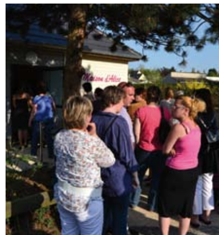
Inauguration de la Maison d'Alice à Othis

de la Plaine de France en faveur d'une meilleure articulation entre vie personnelle et vie professionnelle. Ouvertes à tous, elles devraient favoriser la recherche d'emploi des habitants du territoire.