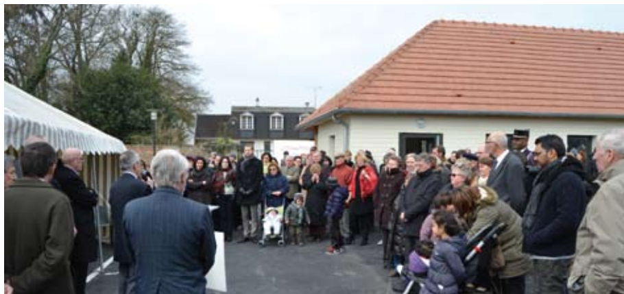
Inauguration de la Maison du Petit Prince à Juilly

A la suite de deux belles cérémonies d'inauguration, ayant rassemblé au total près de 300 personnes, les deux premières micro-crèches de la Plaine de France ont officiellement ouvert leurs portes le 2 avril et le 13 mai.